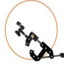
Clamp Mount Kit ACC1000