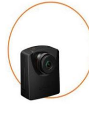
Brinno EMPOWER Time Lapse Camera TLC2000