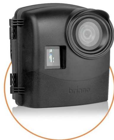
قاب ضد آب