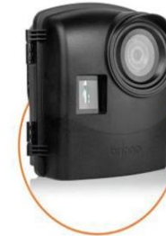
Construction Power Housing ATH2000